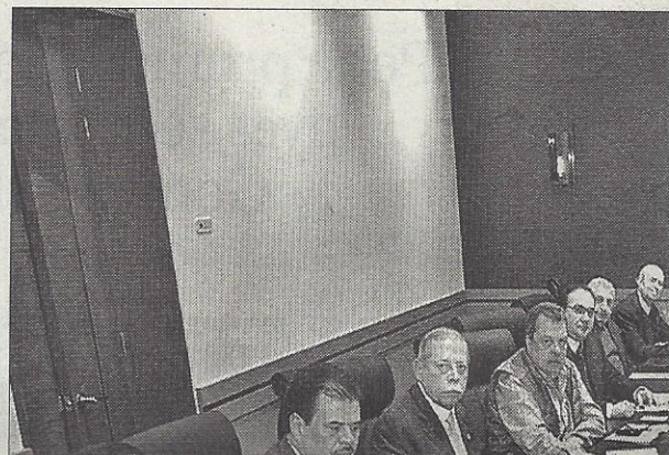
La nueva estrategia antiplagio fue ordenada por el presidente Enrique

Ahí la lleva rumbo a Chilpancingo en el 2015.